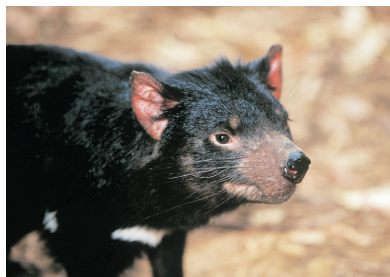
塔斯曼尼亞稀有動物~袋獾