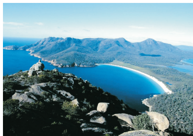
「世界十大最美麗海灣之一」杯酒灣