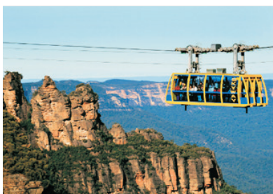
世界自然遺產~藍山國家公園