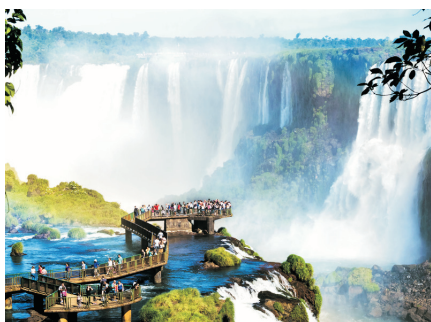
海陸空探索伊瓜蘇瀑布