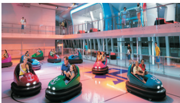
SeaPlex海上多功能運動場*