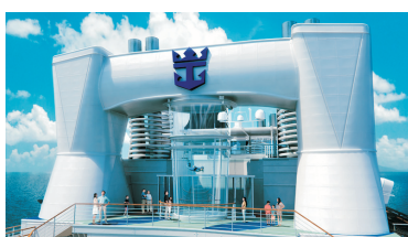
Ripcord by iFly海上跳傘體驗®*