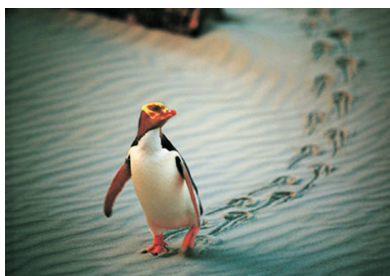
涉臨絕種黃眼企鵝