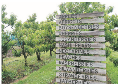
蘇瑞爾水果農莊園