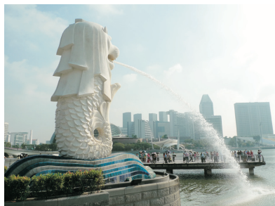
魚尾獅頭像(新加坡)