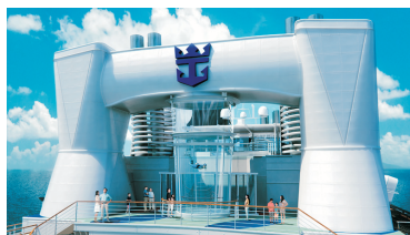
Ripcord by iFly海上跳傘體驗®*