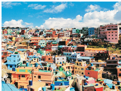
甘川洞文化村(釜山)