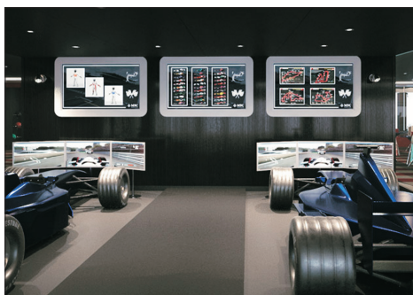
一級方程式模擬賽車