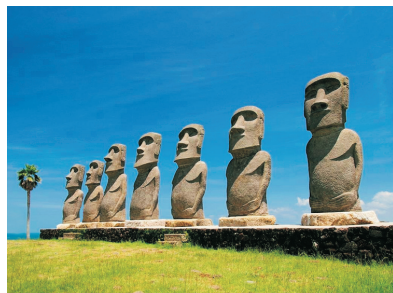
日南太陽公園Sun Messe(宮崎)