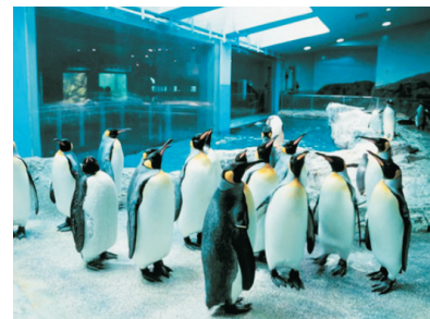
長崎企鵝水族館(長崎)