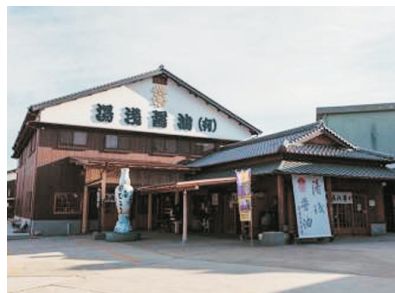
湯淺醬油館(和歌山)

以吉野熊野國立公園的鬼城為背景，將點燃約1萬枚煙花，從兩艘全速前進的船上點燃的煙花，一個接一個地綻放在海上，在水面上呈現出半圓形的花朵。還有另一大亮點是在岩壁上施放的煙火，稱作「鬼城大煙火」。