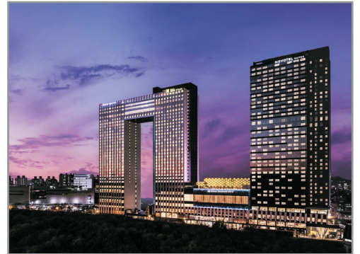
Novotel Ambassador Seoul Yongsan