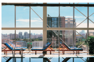
Kempinski Hotel Beijing 凱賓斯基飯店 (www.kempinski.com)