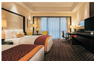
Courtyard by Marriott Beijing Northeast 北京人濟萬怡酒店 (http://www.marriott.com.cn)