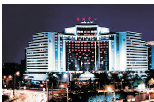
Swissotel Beijing 北京港澳中心瑞士酒店 (www.swissotel.com)

精彩旅程過後，為你提供優質酒店住宿，更可享受酒店各項設施，讓您疲勞盡消。 部分酒店更鄰近大型購物中心，吃喝玩樂任君選擇！