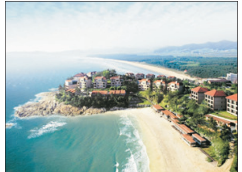
《獨家》曾島EL Dorado Resort