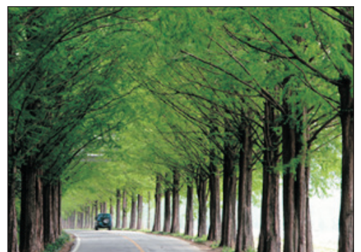
潭陽水杉林蔭大道