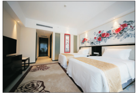
花之城豪生酒店玫瑰房間