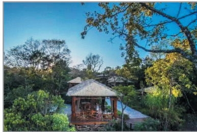
太陽河國家森林公園