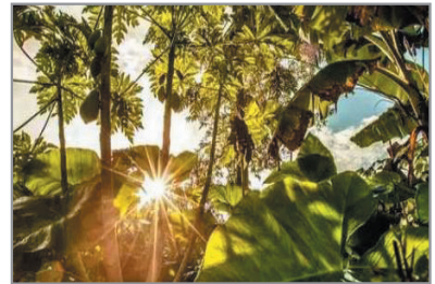
太陽河國家森林公園