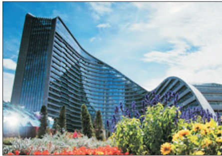
花之城豪生酒店外觀