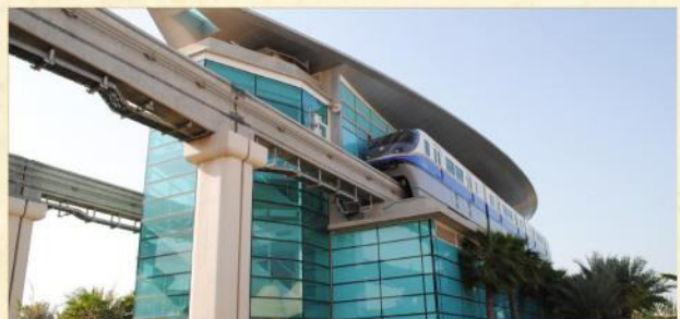
▲ Dubai Monorail單軌鐵路

· 杜拜湖音樂噴泉 ：2009年中全新開幕，高150米，長275米，糅合了音樂和躍動水柱，變幻出1000種不同的聲光效果造型，給你震撼的視覺新享受！