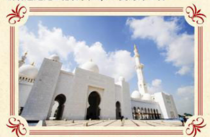
世界第三大 阿布達比大清真寺

遊覽2010年開幕之超級摩天大樓~哈利法塔，樓高828米，更安排乘搭電梯直達124/F全球最高的觀光層飽覽杜拜景色。樓層逾160層，95公里外仍可見。杜拜塔創下了多個世界紀錄，包括世界第一高樓、最高獨立建築、樓層最多、最高戶外觀景台等等。