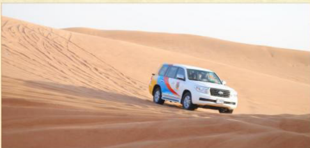
▲ 沙漠四驅車之旅(自費參加)

· 自費活動—沙漠四驅車活動 ：乘坐冷氣四驅車於沙漠起伏不定之沙丘上奔馳，欣賞肚皮舞表演及享用特色燒烤餐。(註4)