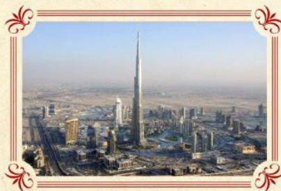
世界最高 哈利法塔Burj Khalifa

2009年中開幕，高150米，長275米，糅合了音樂和躍動水柱，變幻出1000種不同的聲光效果造型，給你震撼的視覺新享受！