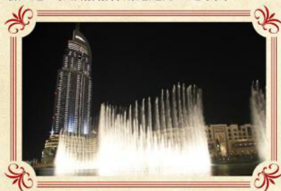
世界最大 杜拜湖音樂噴泉「Dubai Fountain」

容量1100萬公升的水族館，更可以看見魚群暢游，且有魔鬼魚及鯨鯊在潛水員身邊游過的驚險場面吸引遊客。想發掘沉睡海底數千年的亞特蘭堤斯神秘遺跡，還可以穿越大使潟湖下如迷宮一般的海底隧道。本社安排昂貴入場門票，讓你透過玻璃通道近距離觀賞65,000隻海洋生物。