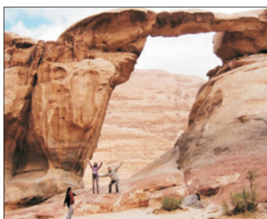
「世界自然及文化雙遺產」 瓦地倫山谷

又名紅玫瑰城，因城堡泥土呈粉紅色，加上陽光照下，斑文紅色美麗奪目，如玫瑰紅艷驕美，始建於公元二世紀，整座城都是以岩石岩洞築成的，所以堪稱最安全的堡壘。