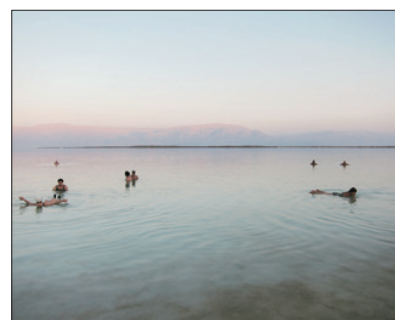
「世界上最深的鹹水湖」 死海

暢遊擁有壯麗地勢景觀之「瓦地倫山谷」，特別安排乘沙漠四驅車，飛馳於獨特的粉紅色沙漠，參觀游牧民族聚居地。