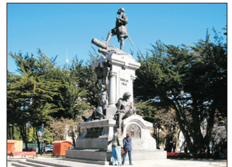
穆尼奧斯·加斯羅廣場