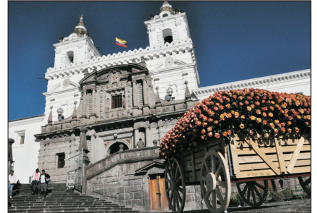
聖弗朗希斯科教堂