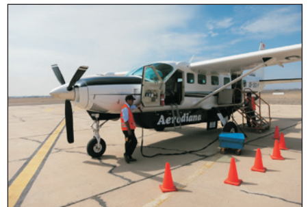
觀光小型飛機空中暢遊