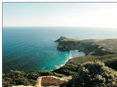
「大西洋及印度洋的交匯處」 好望角