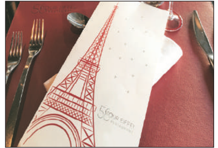
鐵塔餐廳內享用午餐