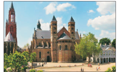
【古老城市】 馬斯垂克

是荷蘭的首都，有「北方威尼斯」及「鑽石之都」之稱。安排乘坐特色玻璃船暢遊荷蘭運河，沿途欣賞兩岸特色建築，然後到訪著名鑽石工場，欣賞鑽石鑲嵌及加工過程。