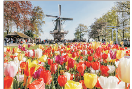
庫肯霍夫荷蘭花展