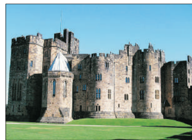
「哈利波特的拍攝場地」 安尼克城堡

建於11世紀，位於蘇格蘭和英格蘭的交界，更是電影《哈利波特》中，主角在霍格華滋學校上飛行課的拍攝場地。