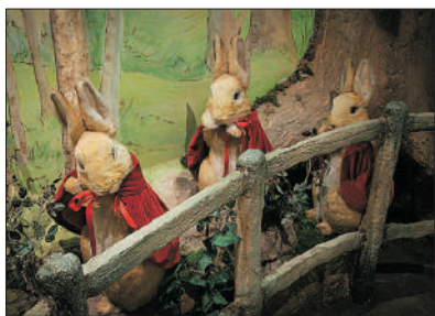
「彼得兔的故鄉」 彼得兔世界博物館