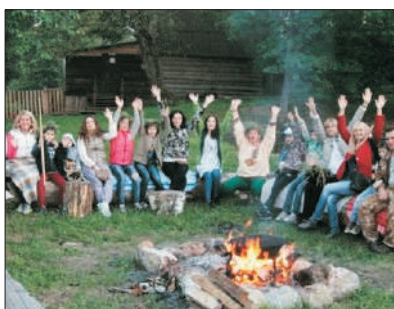
「俄羅斯鄉土文化的精髓」 鐵匠農莊

觀看擠羊奶，照顧馬匹，在雞窩撿雞蛋，爬保佑活到100歲的99級臺階的鐘樓，了解當地民族風俗、建築風格及民族著裝。由當地農場裏種植的蔬菜制作而成的俄式午餐，了解自制伏特加過程，搭火堆，和廚娘一起制作俄羅斯魚湯，戶外傳統遊戲和民俗表演。