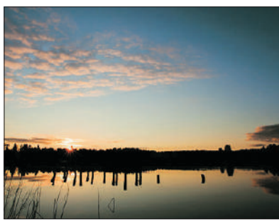
「歐洲最乾淨的湖泊之一」 瓦爾代湖

觀看擠羊奶，照顧馬匹，在雞窩撿雞蛋，爬保佑活到100歲的99級臺階的鐘樓，了解當地民族風俗、建築風格及民族著裝。由當地農場裏種植的蔬菜制作而成的俄式午餐，了解自制伏特加過程，搭火堆，和廚娘一起制作俄羅斯魚湯，戶外傳統遊戲和民俗表演。