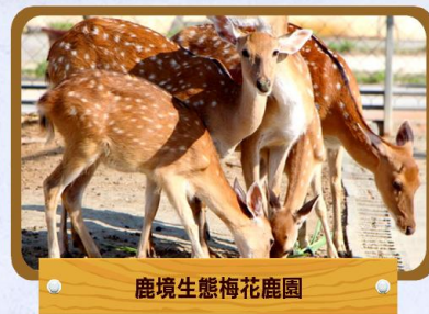
鹿境生態梅花鹿園

位於鵝鑾鼻及風吹砂之間，此區域屬上升的石灰岩台地，由於石灰岩容易被水溶蝕，因此區內有石灰岩洞、崩崖、滲穴、紅土等地形景觀。公園內有大草原，夏天時綠草如茵，亦以日出及觀星聞名。徜徉在遼闊的草原上，可從陡峭的崩崖遠眺曲折有緻的海岸。