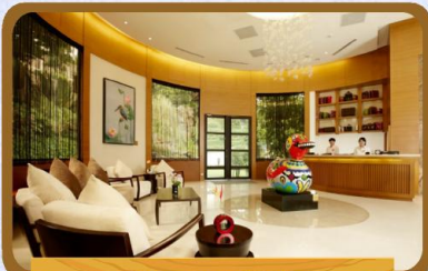
慢活享受養生概念