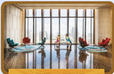
時尚型格的高雄新地標