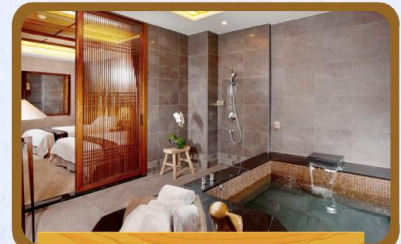
獨立私人湯池客房

酒店是採用「休閒健康、草本養生、天然冷泉」一泊二食慢活住宿概念，取材於地域之自然景觀、四周翠綠竹林，打造飛瀑禪石意象、重現清朝鳳山八景之「岡山樹色」雅致，為客人提供最純淨的度假環境，可盡情享受與家人共享歡樂時光及體驗頂級泡湯的園地。