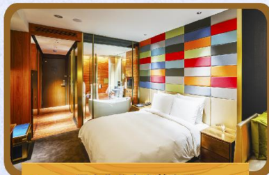
個人化住宿奢華享受