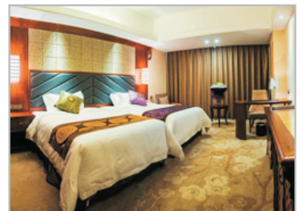
張家界愷力國際酒店

鳳凰古城(包門票)—參觀楊家祠堂、沈從文故居、吊腳樓、沱江泛舟*(包特色遊船)、東門城樓、虹橋藝術樓、石板街、萬名塔、北門城樓、跳岩—長沙 ★如遇大雨或水漲則會取消安排。