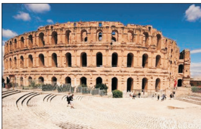
埃爾杰姆羅馬競技場

突尼西亞是世界上少數幾個集中了沙灘、沙漠、山林和古文明的國家。被認為是悠久文明和多元文化的融和之地。這裡匯集了地中海地區所有的古文化遺蹟，建築寺廟、民間風俗。更是古羅馬時代迦太基王國的所在地，深受阿拉伯與伊斯蘭文化的影響。1881年被法國征服成為拿破崙的海外藩屬之一，最後在1956年脫離法國獨立成為今日的突尼西亞共和國。