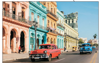
世界遺產 夏灣拿舊城區