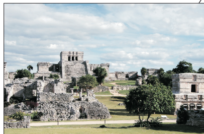
世界遺產 瑪雅遺址圖倫古城