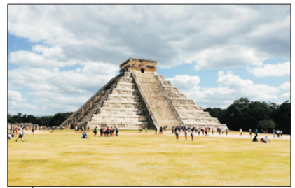
世界遺產 瑪雅遺跡奇琴·伊察