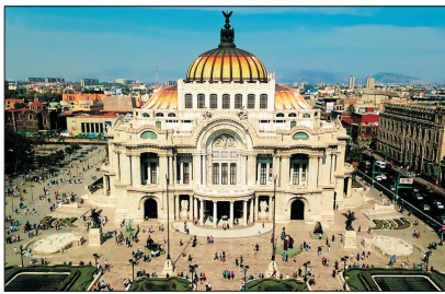
世界遺產 墨西哥城