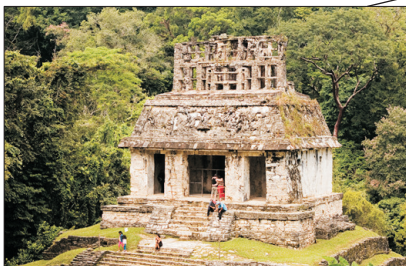
世界遺產 帕倫克古城