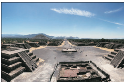
世界遺產 提奧狄華岡