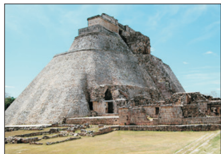
烏蘇曼橢圓形金字塔

~ 烏蘇曼 ：1996年被列為世界遺產的一個擁有瑪雅世界最雄偉的建築。『占師祭壇·橢圓形金字塔』，是古代占師進行向天神祭祀的地方，這裡充滿著瑪雅時期的神秘色彩。