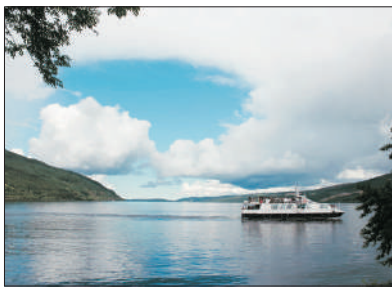
「高地的湖泊」 尼斯湖