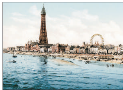
「國際標準舞之都」 布萊克浦～黑池塔

到訪英國以社交舞馳名的西北部地區～布萊克浦(又稱黑池)，亦是海邊的娛樂天堂，其中更座落著黑池最高的建築物—黑池塔。