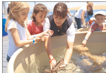
維特港海上水族館

Wirrina Cove-Victor Harbor-Oceanic Victor-Victor Harbor Jetty-McLaren Vale-The Almond Train-Adelaide