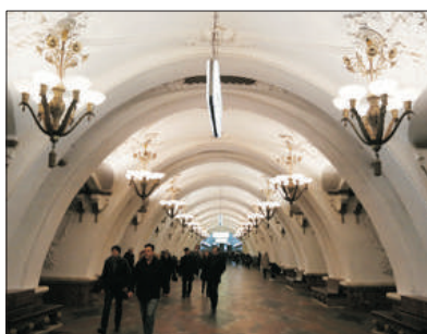
「地下宮殿」 雲石地鐵站

暢遊「世界文化遺產」及俄羅斯經濟、政治中樞~克里姆林宮(包入場)，內裡有多座宏偉而富歷史性的建築物，如沙皇大鐘、巨炮及聖母升天大教堂等，令人嘆為觀止。