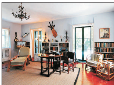
「尋找文豪足跡」 海明威故居

海明威從1940年一直居住到1961年，很多重要的作品也都是在這裏撰寫的，包括著名小說《老人與海》。目前故居還保留著海明威居住時的樣子，隨處可見的書籍和雜誌，接待朋友的起居室等。