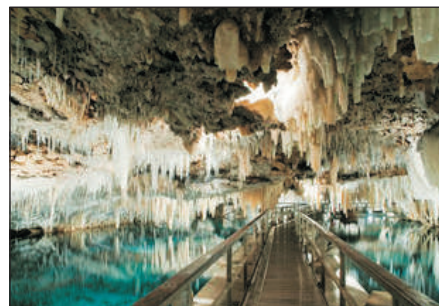
蒙坦沙市鐘乳石洞