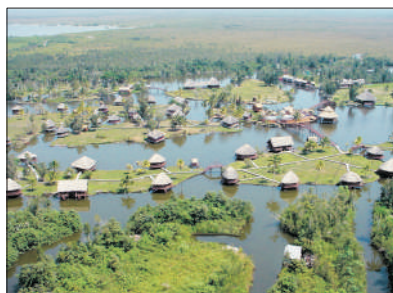
「自然人文景觀」 關瑪濕地公園+印第安人土著村

海明威從1940年一直居住到1961年，很多重要的作品也都是在這裏撰寫的，包括著名小說《老人與海》。目前故居還保留著海明威居住時的樣子，隨處可見的書籍和雜誌，接待朋友的起居室等。