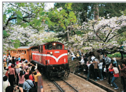
阿里山森林小火車