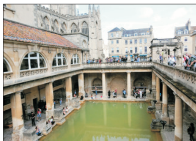
「體驗浴場文化」 古羅馬浴場博物館

前往世界文化遺產～巴斯，參觀古羅馬浴場博物館。在此，如同走回兩千年前的古羅馬，親歷一場古代的浴場文化之旅。