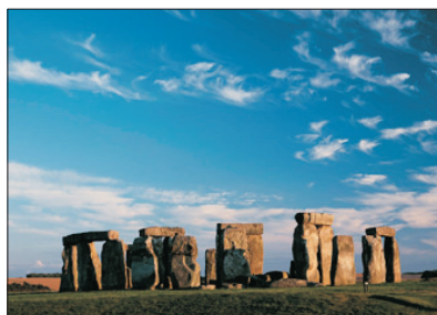
「建造與考古之謎」 巨石陣

前往世界文化遺產～巴斯，參觀古羅馬浴場博物館。在此，如同走回兩千年前的古羅馬，親歷一場古代的浴場文化之旅。