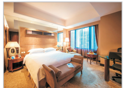
廈門泛太平洋大酒店房間