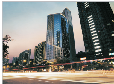
廈門泛太平洋大酒店外觀