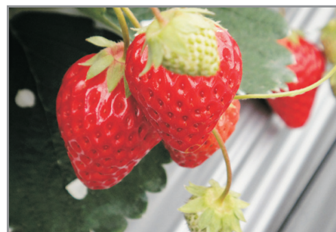
增遊時令果園任食士多啤梨