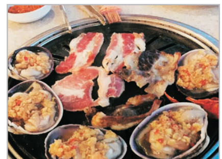
新派韓式自助燒烤