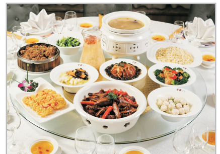
灑江大瀑布飯店民國堂會

~蘆笛岩：洞內有大量玲瓏剔透鐘乳石、石筍、石柱等，結合五彩燈光效果，猶如一座壯麗的地下宮殿。曾接待過國內外首腦及政要，並獲高度的讚揚，故又稱「國賓洞」。景區更新增3D燈光秀，讓遊客於水晶宮內欣賞表演。