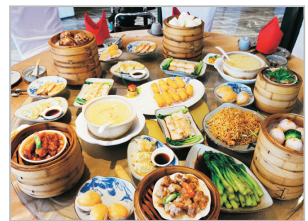
五星級酒店點心宴