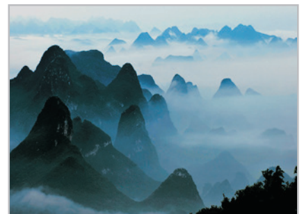
桂林市區最高峰~堯山