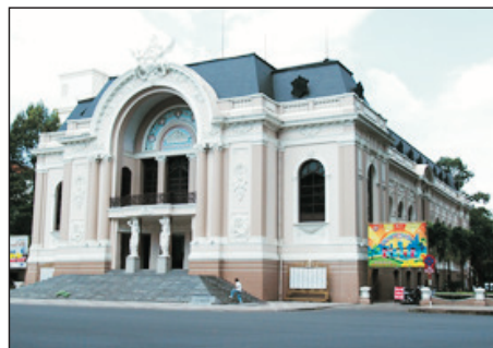
法國風情的市立歌劇院