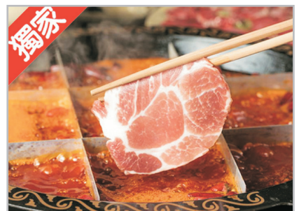
獨家【楚大師鴛鴦火鍋】

816地下核工，是世界上已知最大的人工洞體、全球解密的最大核軍事工程建設，世界獨一無二、不可複製的景區！工程總投資7.4億元。至1984年停建時，已完成85%的建築工程、60%的安裝工程。2002年4月國防科工委下令解密，816地下核工程才得以公之於眾。