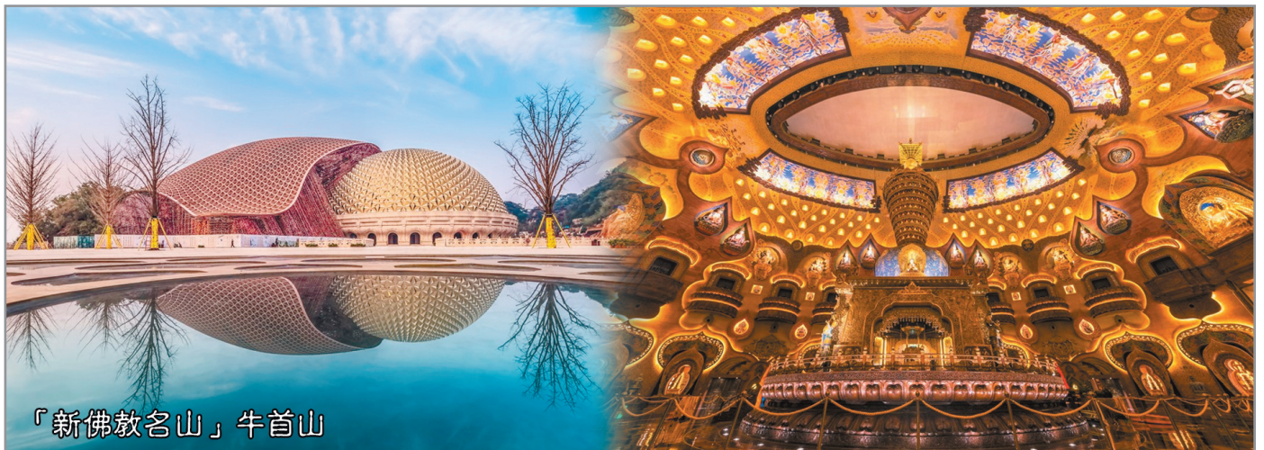
「新佛教名山」牛首山