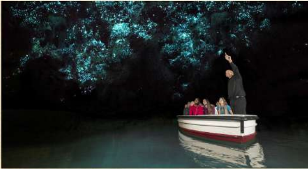
▲ 懷托摩鐘乳石及螢火蟲洞

羅托魯亞▶蒂普瓦毛利文化及地熱保護區▶鹿產品廠〈每位貴賓均可獲贈鹿茸花蜜一瓶(備註17)〉▶懷托摩鐘乳石洞及螢火蟲洞(世界自然奇景) ▶奧克蘭 Rotorua▶Te Puia▶Deer Shop▶Waitomo Glow Worm Cave▶Auckland