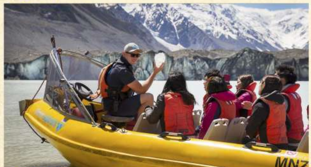
▲ 塔斯曼冰河船之旅

#若因天氣關係或維修情況而取消觀星之旅，本公司將退回相關之款項。另基於安全條例，觀星之旅凡8歲以下小童不能參加此行程，敬請注意。