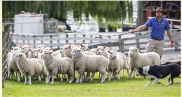
▲ 瓦爾特峰高原牧場

皇后鎮▶厄恩斯勞號百年蒸汽船、瓦爾特峰高原牧場(觀賞剪羊毛表演及享用豐富BBQ午餐)▶下午自由活動(可自費參加本公司領隊代安排之活動，詳情參閱新西蘭「自費項目表」) Queenstown▶TSS Earnslaw Cruises▶Farm Show▶Afternoon Free For Leisure▶Queenstown