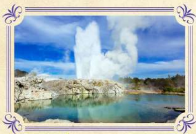
蒂普瓦毛利文化及地熱保護區

▶乘坐登山纜車到達600米高的博士峰山頂，於被選為世界最佳景觀的餐廳一邊享用自助午餐，一邊飽覽有「世外桃源」美譽之稱的皇后鎮湖光山色美景。