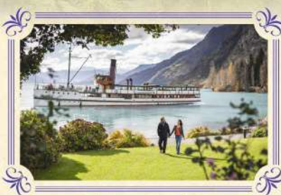
厄恩斯勞號百年蒸汽船

▶專業導賞員帶領您使用專業的天文望遠鏡觀賞迷人的銀河系及探索壯麗南部天空的不同元素，並由華籍專業導賞員為您解說天文知識，以雷射光導引觀賞。貴賓更可透過不同類型的天文望遠鏡觀看燦爛的星空，美麗得令人感動。