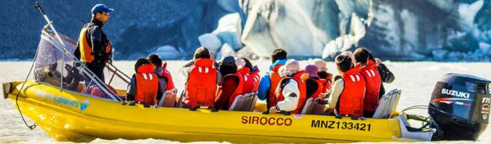
▲ 塔斯曼冰河船之旅