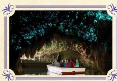
懷托摩鐘乳石及螢火蟲洞

▶蒂普瓦毛利文化及地熱保護區坐落於羅托魯亞城市的邊緣，佔地面積達70公頃，蒂普瓦擁有舉世聞名的間歇噴泉、地熱溫泉、矽質岩層等，遊客亦可在這裡親身深入了解新西蘭原住民～毛利族人的悠久歷史、傳統文化及習俗。