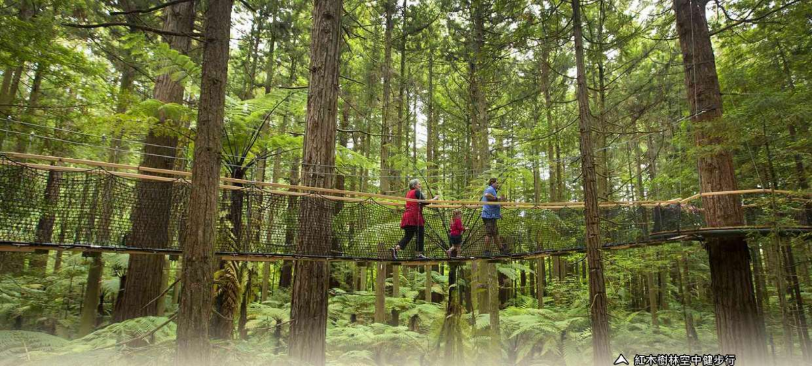
△ 紅木樹林空中健步行