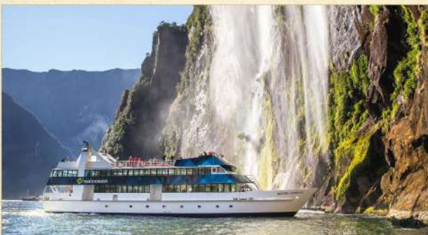
▲ 美福灣大自然之旅(自費參加)

• 皇后鎮：座落在新西蘭第三大湖畔瓦卡蒂普湖岸邊，背靠卓越山脈，四周環山，風光如畫。因地理環境關係，各式各樣刺激活動盡在此。這個小鎮亦是通往風光冠絕新西蘭的美福灣重要關口，可選乘觀光巴士或飛機前往，湖光山色美不勝收。