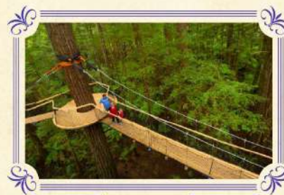
紅木樹林空中健步行 (包門票)

▶參觀形狀千奇百怪的石灰岩鐘乳石洞，然後乘坐小遊覽船摸黑在螢光蟲洞內漫遊，欣賞著名藍色螢火蟲，點點蟲光恍如黑夜中閃爍的繁星，難忘體驗。