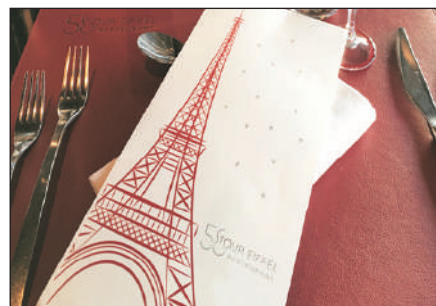
鐵塔餐廳內享用午餐

· 巴黎 ：乘專車遊覽這個浪漫迷人的花都。首先前往位於塞納河畔之艾菲爾鐵塔及拿破崙墓拍照念。續往宏偉莊嚴而又代表法國民族精神之凱旋門、昔日大革命時斷頭台所在地的協和廣場等。