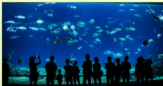
▲ 國立海洋生物博物館

國立海洋生物博物館：位於南台灣風光秀麗的海岸旁，為南亞最大的海洋博物館，館內有全亞洲最長的海底隧道和全世界最大的珊瑚。位於入口處的親子嬉水池有數條接近真實比例的巨大鯨魚模型。而海生館的新寵兒～俄羅斯小白鯨，更是大家必定探訪的對象。而新開幕之世界水域館，以3D立體模擬實境構成，讓您以不同角度探索海底世界。