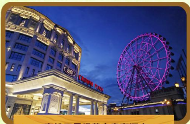
高雄五星級義大皇家酒店

統一渡假村墾丁海洋體驗樂園/小墾丁度假村、義大遊樂世界、 淨園休閒農場、夢時代購物中心、黃金菠蘿城堡~鳳梨酥DIY體驗、 墾丁大街、國立海洋生物博物館、龍磐公園、恆春古城、六合夜市