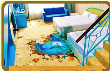
墾丁統一渡假村墾丁海洋體驗樂園

環抱觀音山悠悠綠意，是全台唯一結合休閒度假飯店、大型購物商場、主題遊樂園和藝術生態於一體的多元化度假休閒勝地。 每間房都特別設計獨立露台，讓您盡覽美麗風光，以及舒適寬敞的客房設計，讓賓客身心得以徹底放鬆。