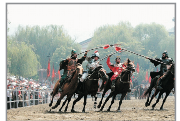
三國影視城(三英戰呂布真人戰馬秀)