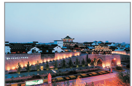
蘇州吳宮泛太平洋酒店

蘇州歷史最悠久的五星級豪華酒店。與盤門景區相鄰，與十全街、山塘街為友，大氣的城樓與精緻優雅的園林小品讓您不出酒店就能領略到蘇州園林的迷人之處。古典與現代的設計風格相互融合，串聯起古典的中華美學理念與傳統的蘇州園林風韻。