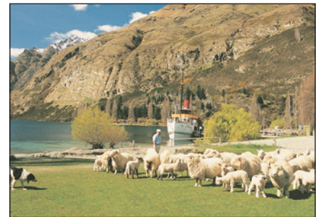
瓦爾特峰高原牧場