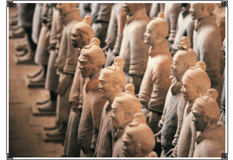
秦始皇兵馬俑博物館

～秦始皇兵馬俑博物館：被譽為世界第八大奇蹟及評為「世界文化遺產」的秦始皇兵馬俑，放滿了一排排如同真人般高大的陶質武士俑及車馬俑，其創作氣魄之大，可稱世界一大奇景。 ～烏魯木齊：新疆自治區首府「烏魯木齊」原是蒙古語，意譯是「優美的牧場」。