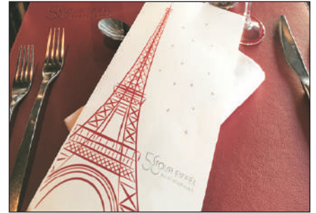
鐵塔餐廳內享用午餐