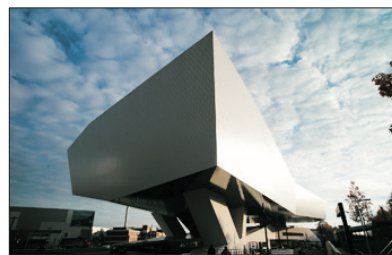
「汽車迷至愛」 保時捷博物館

特別遊覽風景怡人的無煙環保城～采爾瑪特，瑞士有九個環保鎮，全城沒有汽車，只有小量以電池推動的小車作運輸之用，居民都喜愛徒步於大街小巷，間中更可見以馬車代步的居民，煞是有趣！