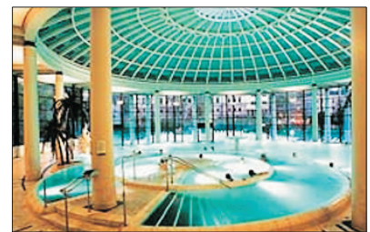
「寫意溫泉樂」 包入場享受巴登巴登 Caracalla Spa健康溫泉

佔地5600平方米的展區中陳列著超過80輛不同型號車款，由1900年打造的世界第一款混合動力車～傳奇車型，直到最新一代的保時捷。博物館以“車輪上的博物館”概念展出保時捷歷史、跑車工作流程一一展示，它成為了全球保時捷跑車迷的聚集地。