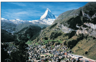
「無煙環保城」 采爾瑪特

特別遊覽風景怡人的無煙環保城～采爾瑪特，瑞士有九個環保鎮，全城沒有汽車，只有小量以電池推動的小車作運輸之用，居民都喜愛徒步於大街小巷，間中更可見以馬車代步的居民，煞是有趣！