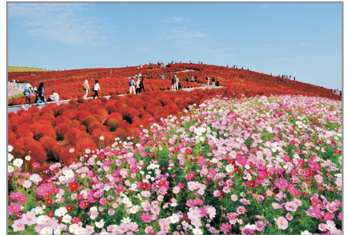
日立海濱公園掃帚草

「世界文化遺產」日光東照宮、二荒山神社、 「日本三大瀑布之一」華嚴瀑布、「日本三大名園」偕樂園、 日立海濱公園、茨城花之樂園、川越小江戸、 東京皇居(二重橋)、新宿購物大道、淺草、雷門觀音寺 《出發日期：9月29日》