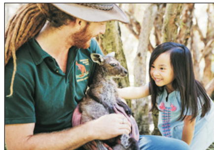
卡弗沙姆野生動物園

Perth-Caversham Wildlife Park-Chocolate Factory-Swan Valley-Mandoon Estate Winery-Honey Shop-King's Park-Elizabeth Quay-Bell Tower(Take Photo of Exterior)