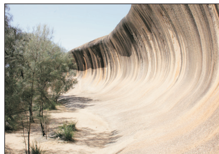
波浪岩之旅(自費參加)

# 粉紅湖之湖水顏色深或淺是乃大自然之現象。這與當時的氣候、湖水的溫度及水裡的藻類生長情況有直接的關係。因此客人不可因湖水顏色太淺或不夠粉紅色，而要求本公司作出任何賠償，敬請留意。