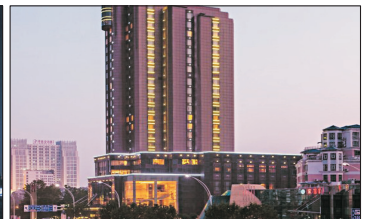
光明萬麗酒店外觀