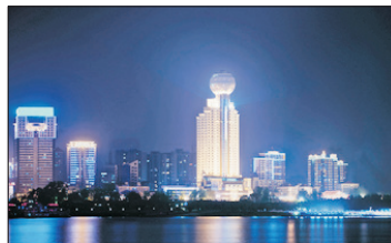
明珠豪生酒店外觀

武漢入住2晚明珠豪生酒店(坐落武漢市中心，毗鄰多個著名景點，周邊更有著名的酒吧一條街)或光明萬麗酒店(屬國際品牌萬豪集團旗下，位置方便，集現代感與優雅設計於一體)或同級。