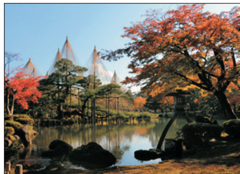
「日本三大名園」兼六園