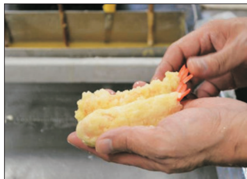
食品樣本工房體驗